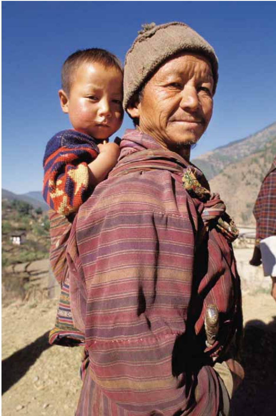
Far bærer sin søn på ryggen i Chukkha provinsen.

indsats for at diversificere økonomien og dermed skabe betingelser, som muliggør en bredt funderet økonomisk vækst og sikre beskæftigelsesmuligheder for den voksende befolkning. Trods den positive økonomiske udvikling, er Bhutans økonomi stadig sårbar. For det første er Bhutans økonomi ensidigt afhængig af indtægter fra eksport af vandkraftbaseret elektricitet til Indien. For det andet fortsætter den udbredte fattigdom med et stort skel mellem rig og fattig. For det tredje har Bhutan en høj gæld i forhold til landets Brutto National Produkt.