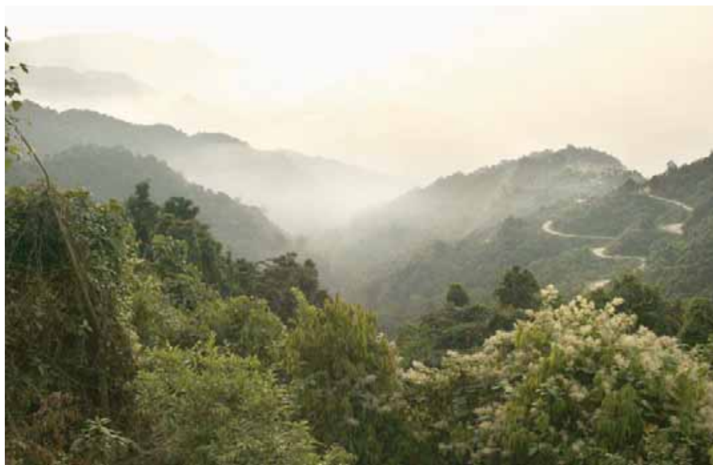
Bjerglandskab - over 60% af Bhutan er dækket af skov.

Baseret på klimagennemgangen af danske programmer i 2008 inkluderes relevante tilpasningsaktiviteter og effekter af klimaforandringer i programmet.