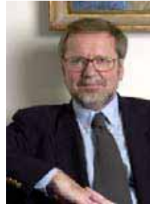
Per Stig Møller, Ministro de Relaciones Exteriores

La estrategia para América Latina es un documento vivo, y el gobierno evaluará en forma continua la ejecución de la estrategia, al igual que considerará nuevas acciones posibles. El gobierno establecerá un diálogo con las partes interesadas danesas del sector empresarial, del mundo de la investigación y el medio de las ONGs con el objetivo de discutir nuevas iniciativas que puedan fortalecer la salvaguarda de los intereses daneses y su presencia en América Latina.