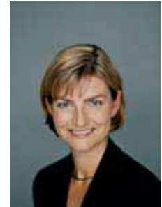
Ulla Tørnæs, Ministra de Desarrollo