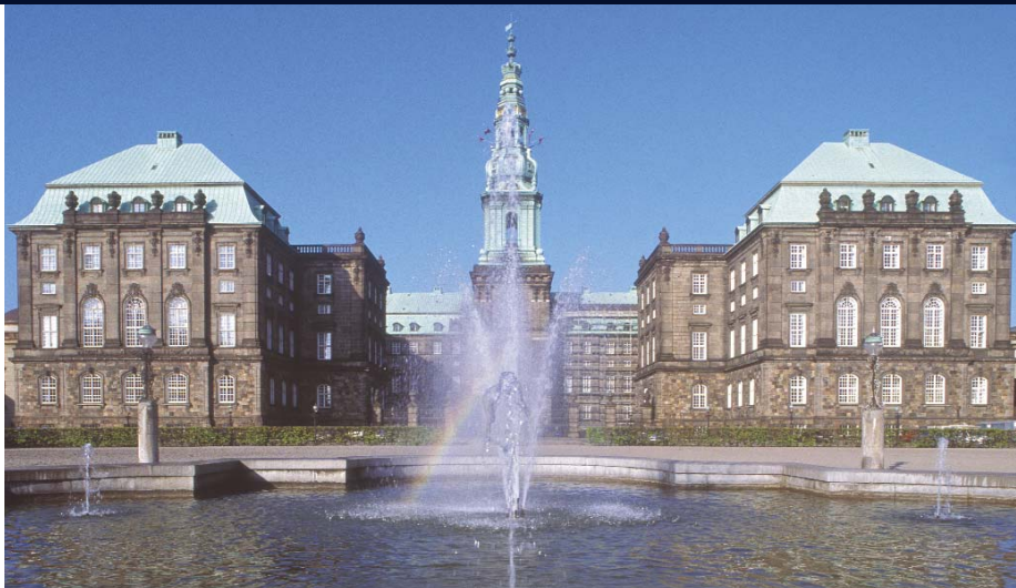
Le château de Christiansborg, au centre de Copenhague, est le siège du Folketing, le Parlement danois.

Il serait difficile de bien comprendre le régime politique danois sans une analyse de la vie politique au delà des institutions officielles. Après 1875, la société danoise a connu, parallèlement à l'organisation de la vie politique, une très forte organisation du monde du travail, du commerce et de l'industrie. Ajoutons à cela la création des hautes écoles populaires, puis d'une série d'associations de bénévoles rattachées aux partis politiques et destinées à vulgariser le savoir. Pendant la Première Guerre mondiale, de 1914 à 1918, le syndicalisme fit des progrès décisifs et depuis lors, pratiquement toutes les catégories des citoyens danois font partie d'un syndicat professionnel, commercial ou industriel, d'associations culturelles ou de clubs de loisirs. À l'aube du troisième millénaire, tous les Danois âgés de 18 à 70 ans étaient membres de trois organisations en moyenne. La culture démocratique des Danois s'enracine très largement dans ces multiples sociétés et