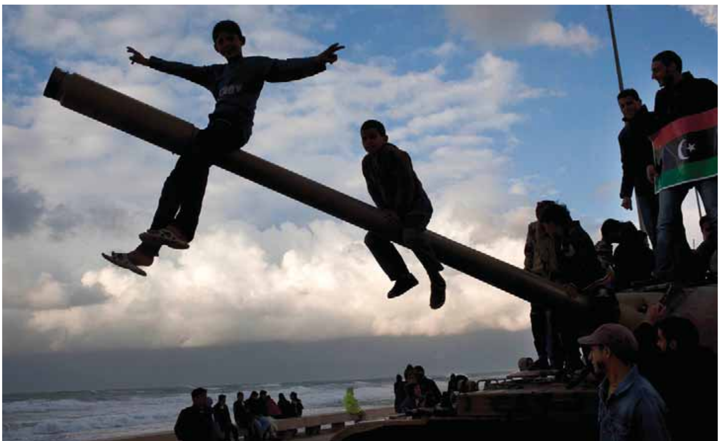
Libyske oprørere fejrer, at Benghazi er under oprørernes kontrol, 2011.