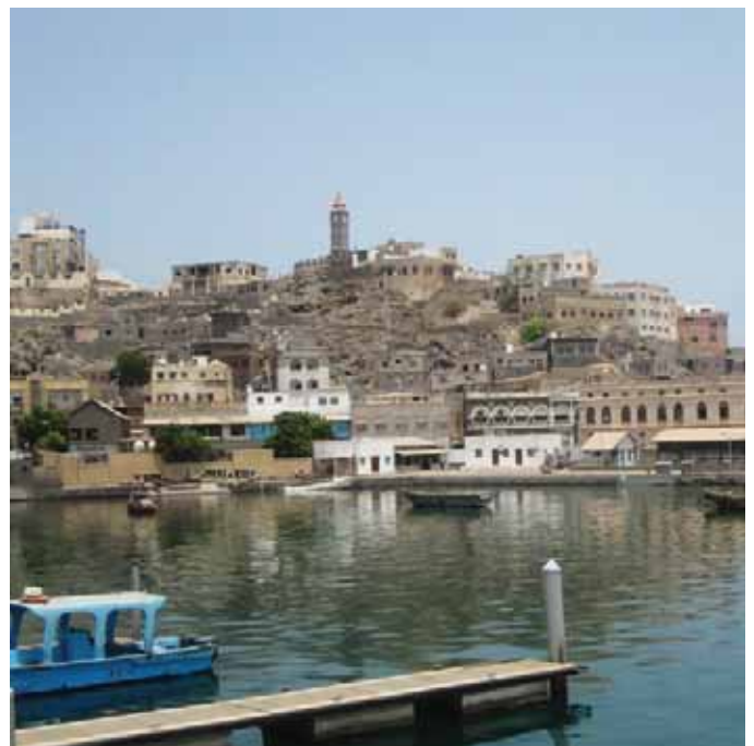
Kystvagtssamarbejde Aden Havn, Yemen, 2013.

Opbygning af legitime og repræsentative lokale og statslige institutioner er meget vigtige i forhold til at sikre stabiliseringsindsatsers langsigtede holdbarhed. Ofte undervurderes vanskelighederne og tidshorizonten ved at opbygge legitime og effektive lokale institutioner og fremme inklusive politiske processer. Disse udviklingsprocesser er omfattende og kræver tålmodighed og 'et langt sejt træk'. På denne baggrund spiller kapacitetsopbygningen, bl.a. gennem forsvarets og de civilt udsendte eksperter, en stadig større rolle. Et vigtigt element i kapacitetsopbygningen er en styrkelse af den demokratiske kontrol med sikkerhedssektoren. Støtte til retsreform (Rule of Law) er ofte afgørende for at sikre overholdelse af basale retsstatsprincipper og sikre langsigtet stabilitet.