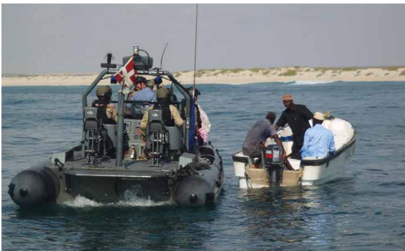
Besætning på Iver Huitfeldt i dialog med lokale ledere, Adenbugten, 2013.