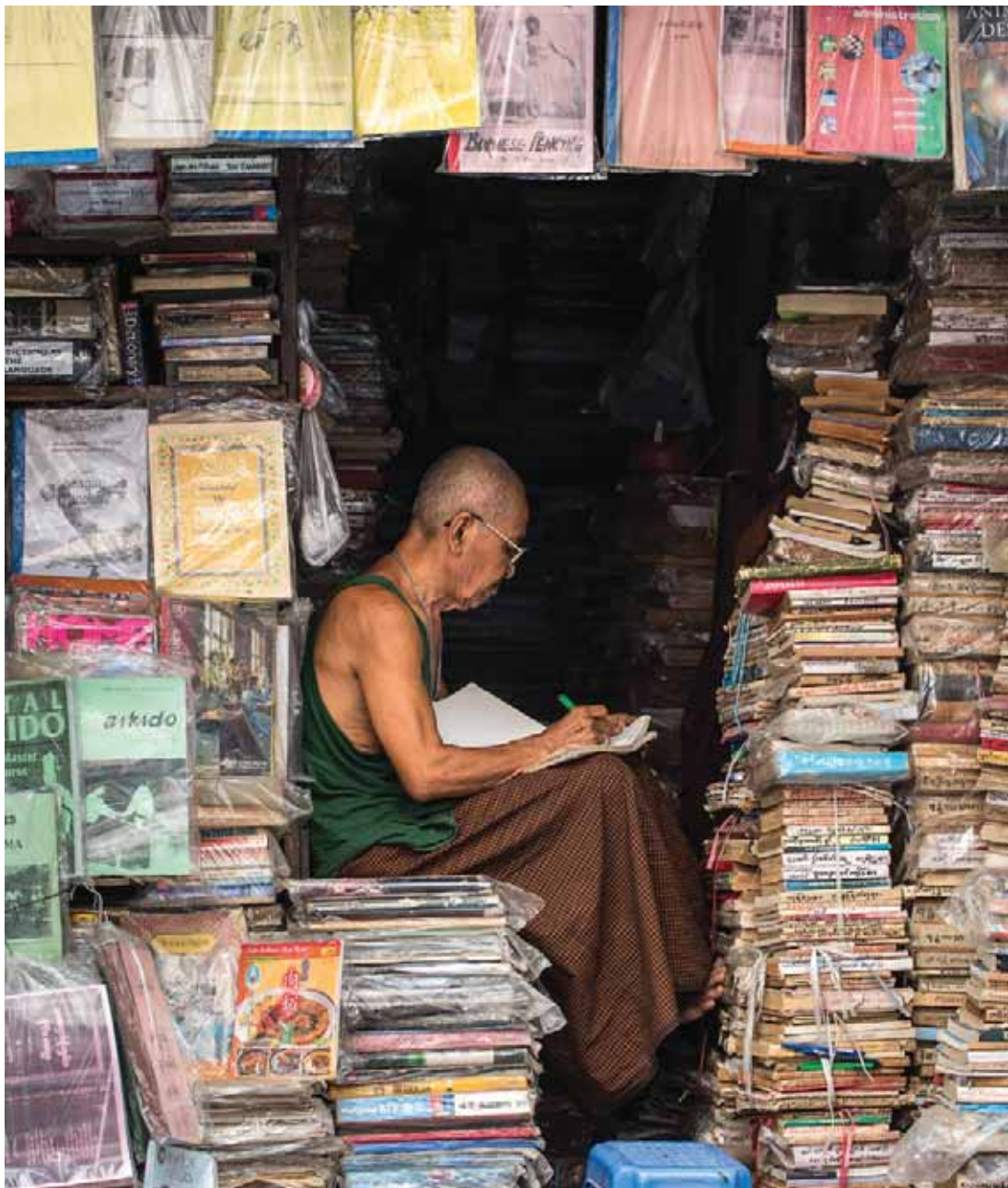
Demokratisering i Burma: Indehaver af boghandel. 2013. DANIDA.