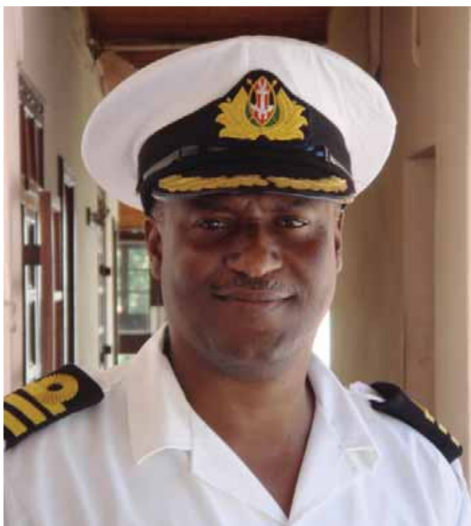
Kenyansk flådeofficer. Mombasa. Dansk-kenyansk flådesamarbejde. 2011.

er indsat danske styrkebidrag. I Østafrika ydes der assistance til opbygningen af den kenyanske kystvagt og den østafrikanske reaktionsstyrke for at sikre denne regions langsigtede stabilitet. Forsvaret har også siden konflikterne på Balkan i 1990'erne haft et sikkerhedssamarbejde med regionens lande, hvilket har bidraget til en langsigtet positiv udvikling for regionens sikkerhedsinstitutioner. Hjemmeværnet har også kapaciteter, der kan anvendes i stabiliseringsindsatser. Operativt har hjemmeværnet bl.a. været anvendt til bevogtningsopgaver, mens man inden for kapacitetsopbygning har deltaget i bl.a. træning og uddannelse af sikkerhedsstyrker.