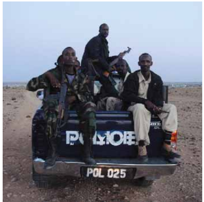
Puntland Special Protection Force , Garowe, Somalia.

Samtækningsstrukturen udgør den institutionelle, strategiske struktur i de danske samtænkte stabiliseringsindsatser, men der foregår også samtænkning på mange andre niveauer og direkte mellem forskellige aktører, uden at samtækningsstrukturen er involveret.