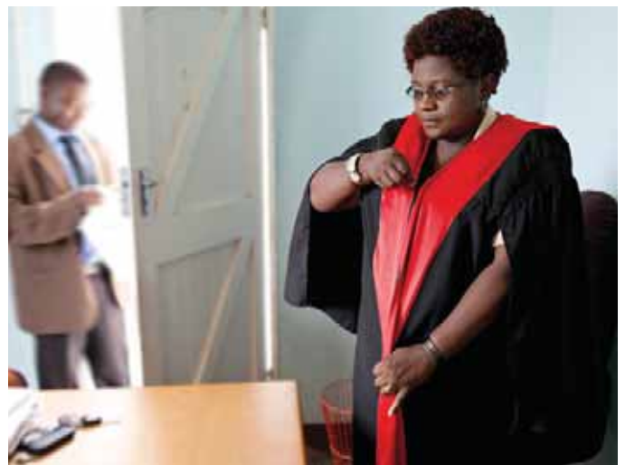
Demokratisering i Zimbabwe: Retsmøde i Magistrates Court i Murewa. 2011.

Der er en ganske betydelig indsats over den samlede, fattigdomsorienterede udviklingsbistand, der bidrager til konfliktforebyggelse og fremme af stabile og inklusive samfund. Udviklingsbistanden har blandt sine prioritetsområder fokus på stabilitet og beskyttelse, herunder på at opbygge og genopbygge vitale samfundsinstitutioner, skabe vækst og beskæftigelse og mere generelt skabe de bedste rammer for borgeres inddragelse og deltagelse i det politiske liv, hvilket skaber tillid i befolkningen til staten. Undersøgelser i Afghanistan viser f.eks., at jobskabelse og økonomisk udvikling er en topprioritet. Det internationale samfunds fælles bidrag kan her bidrage til at fremme stabiliteten og den langsigtede udvikling.