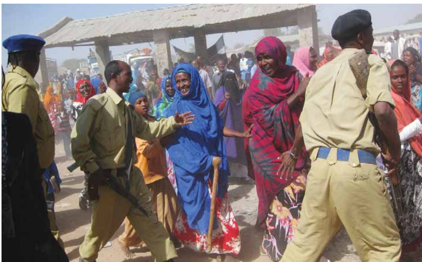
Dyremarked i Hargeisa, Somaliland, 2010.