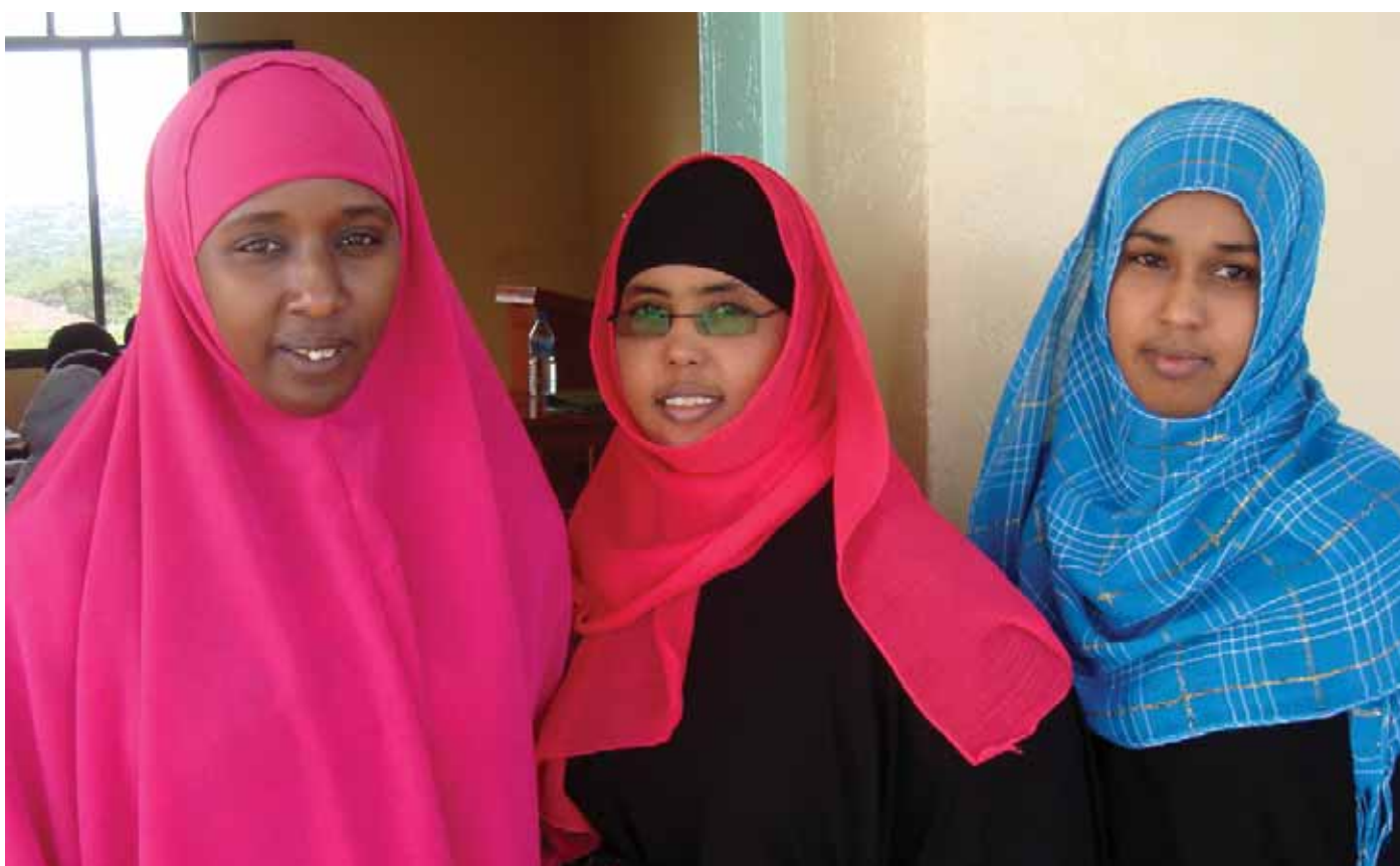
De første dimitterede kvindelige anklagere fra Hargeisa University, Somaliland, 2011.