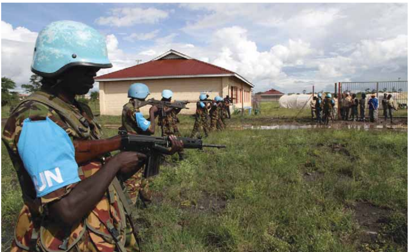
Træning af kenyanske Rapid Response styrker, 2013.