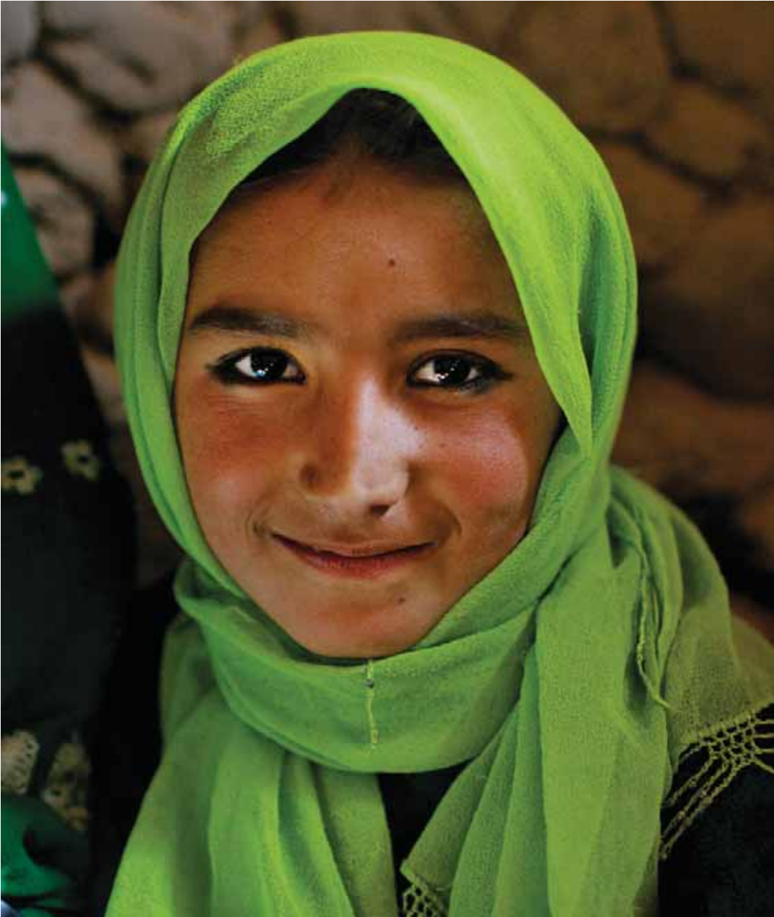
Afghansk pige , Feyzabad, Afghanistan. 2008.