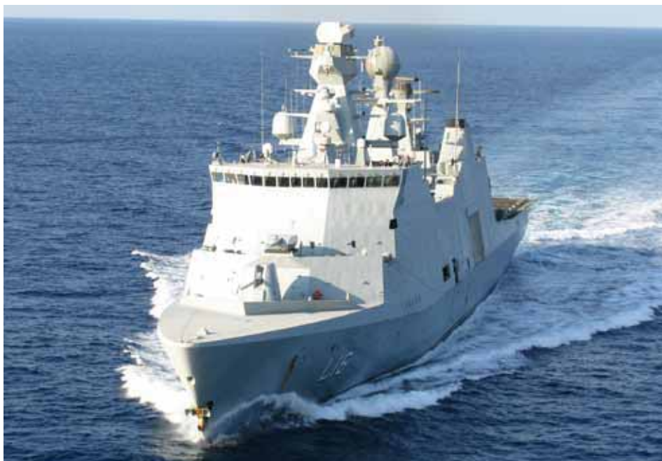
Det danske skib Absalon.

nem resolutionerne 1816 (2008), 1816 (2009), 1816 (2009), 1816 (2009) og 1816 (2011) sat rammerne for de internationale bestræ-